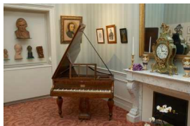
La Bibliothèque Polonaise

Téléchargeable sur le site www.paris.fr dès le mois de février.