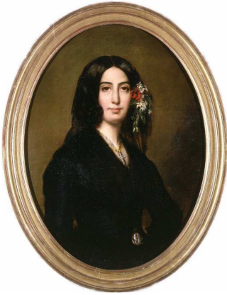
Auguste Charpentier : George Sand - 1838 Musée de la Vie romantique, Paris

Le 16 juillet 1831, Frédéric Chopin écrit à sa famille restée en Pologne « apprenez que j'ai fait viser mon passeport pour Londres »... Un passeport pour Londres qui toutefois mentionne « via Paris ».