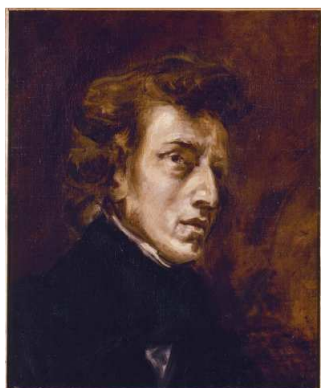
Eugène Delacroix : Frédéric Chopin - 1838 Musée du Louvre, Paris

Conçu spécifiquement pour la maison de la rue Chaptal où Chopin se rendait en voisin et ami, cet hommage sera une évocation de ses années parisiennes (1831-1849).