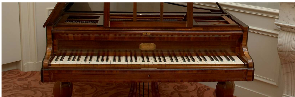
Piano Pleyel, Bibliothèque polonaise