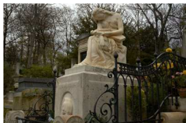
La tombe de Chopin