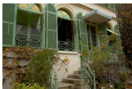
Musée de la Vie romantique