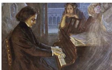
Lionello Balestrieri : Frédéric Chopin composant "Les Préludes"

Cœur du romantisme et centre culturel de l'Europe irrigant tous les nouveaux courants artistiques, Paris fut un terrain fertile pour Chopin où s'épanouit son génie musical. Il y croisa les artistes du siècle (Rossini, Mendelssohn, Liszt et Hiller, Delacroix, George Sand etc.) et fut ainsi propulsé au devant d'une scène artistique qui bâtit sa gloire.