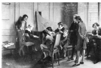
Andrew Gow : La Musique de Chopin Tate Gallery, Londres

Il meurt dans son appartement de la place Vendôme dans la nuit du 17 octobre 1849, entouré d'amis et de musique.